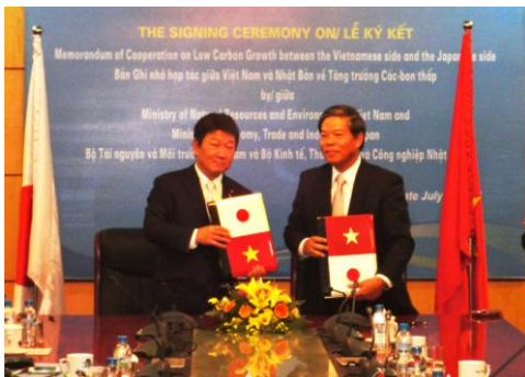
クアン天然資源環境大臣との会談・ 二国間クレジット協力覚書署名式

また、アセアン最初の地球温暖化対策を推進する二国間クレジットに係る協力覚書に署名するとともに、スマートコミュニティプロジェクト推進のための民間合意を締結し、地球温暖化対策における両国の協力を推進しました。