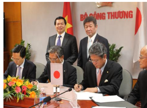
スマートコミュニティ民間合意締結式