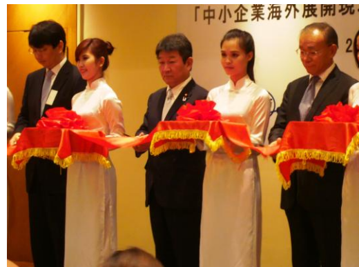
海外展開現地支援プラットフォーム 発足式