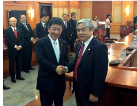
クアン科学技術大臣との会談